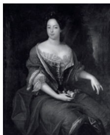
Sophie Charlotte von Hannover, porträtiert v. N. Jouvenet (1650–1698)