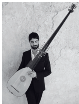
Alon Sariel © Concerto Foscari

Termin: 26. Oktober, 17 Uhr Ort: Turmzimmer der Neustädter Hof- und Stadtkirche Kosten: Eintritt frei, Anmeldung nicht erforderlich